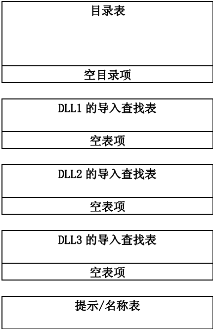
图 3. 典型的导入节布局

导入目录表是导入信息的开始部分，它描述了导入信息中其余部分的内容。导入目录表包含地址信息，这些地址信息用来修正对 DLL 映像中的相应函数的引用。导入目录表是由导入目录项组成的数组，每个导入目录项对应着一个导入的 DLL。最后一个导入目录项是空的（全部域的值都为 NULL），用来指明目录表的结尾。