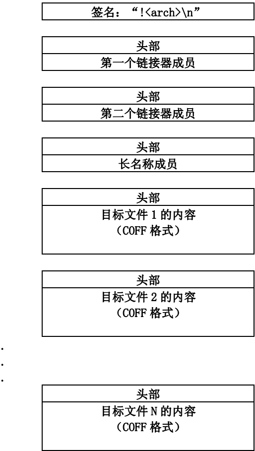
图 4. 档案文件结构